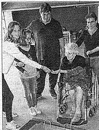
■ Cuiseaux semaine bleue.

Le Centre culturel et social a joué cette année encore un rôle de coordination pour les activités organisées sur le territoire à l'occasion de la Semaine bleue, en faveur des personnes âgées. Les maisons de retraite, la résidence des Écureuils, ont proposé ou participé à diverses animations : spectacle, sortie promenade, loto gourmand, jeux avec la ludothèque de Cuiseaux, goûters. Avec l'occasion d'échanges intergénérationnels très appréciés des plus jeunes comme de leurs aînés.